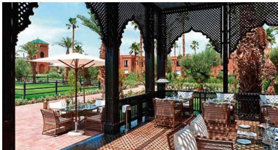
Cinq ans de travaux, un grand nom de l'architecture et bientôt seize pur-sang arabes aux écuries.