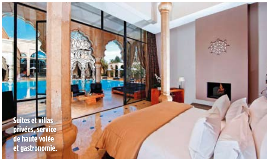
Suites et villas privées, service de haute volée et gastronomie.

A partir de 390 € la nuit. (212) 5.24.29.98.00, www.palaisnamaskar.com et www.lhw.com.