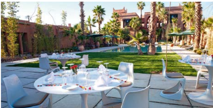
Restauration légère au bar de la piscine du Tigmiza. Au 1 er étage, on profitera du soleil couchant.

■■■ et leur sens inné de l'hospitalité. En résulte cet ovni, mi-chambres d'hôtes mi boutique-hôtel, où les objets chinois se mêlent aux portes sculptées, où les rideaux brodés et les boiseries peintes à la main se déclinent au gré des suites thématiques (anglaise, Majorelle, chinoise, Art déco...), subtiles invitations au voyage.